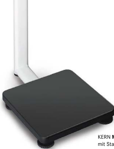
KERN MPS-PM mit Stativ