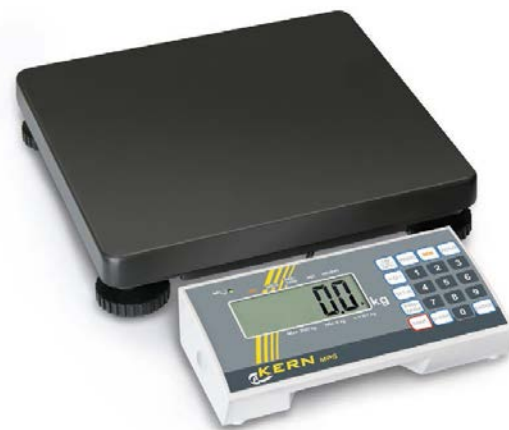
KERN MPS-M mit freistehendem Auswertegerät